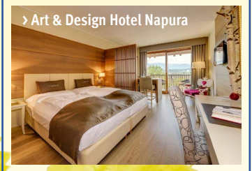
» Art & Design Hotel Napura