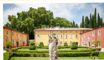
» Relais & Châteaux Hotel Villa Cordevigo

Nach einem ausgedehnten Frühstück treten Sie die Heimreise über Mailand und die Schweiz an. Die Rückkunft in Saarbrücken erfolgt zwischen ca. 19.30 Uhr und 21.00 Uhr, in den anderen Zustiegsorten entsprechend später.